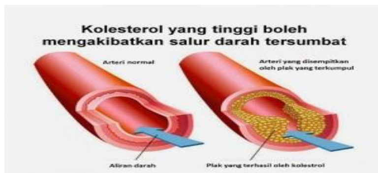
Gambar 2.1. Pembuluh darah normal dan pembuluh darah yang tersumbat

Menurut WHO (2012) nilai normal pada kolesterol total yaitu <200 mg/dL. Berbeda dengan fungsinya pada saat kolesterol normal, semakin tinggi dalam darah, semakin besar juga resiko terjadi aterosklerosis. Aterosklerosis adalah penebalan dinding pembuluh arteri sehingga lubang pada pembuluh darah akan menyempit (Anggraeni, 2016).