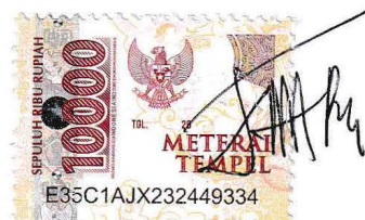
Roziqo Baihaqi Nur Susilo