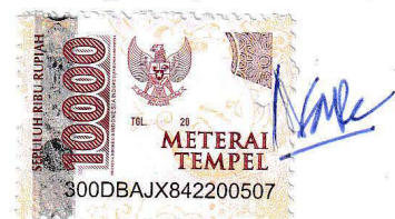
Naufal Fikriy Al Fauzan