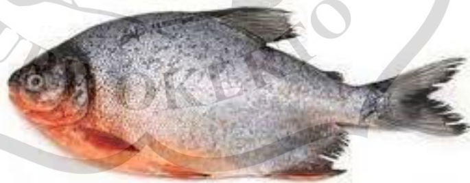
Gambar 2.8 Ikan Bawal

Ikan bawal memiliki morfologi yang mirip dengan ikan piranha, dengan tubuh yang berbentuk agak bulat dan pipih. Sisik ikan ini kecil, kepala berbentuk hampir bulat, dan lubang hidungnya besar. Sirip dada terletak di bawah tutup insang, dan terdapat pemisahan yang jelas antara sirip perut dan sirip dubur. Warna punggung ikan bawal adalah abu-abu tua, sedangkan bagian perutnya berwarna putih abu-abu dan merah. Ikan bawal menunjukkan pertumbuhan yang relatif cepat dibandingkan dengan beberapa spesies ikan air tawar lainnya. Ikan bawal bisa dilihat pada Gambar 2.8.