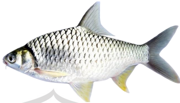
Gambar 2.10 Ikan Tawes