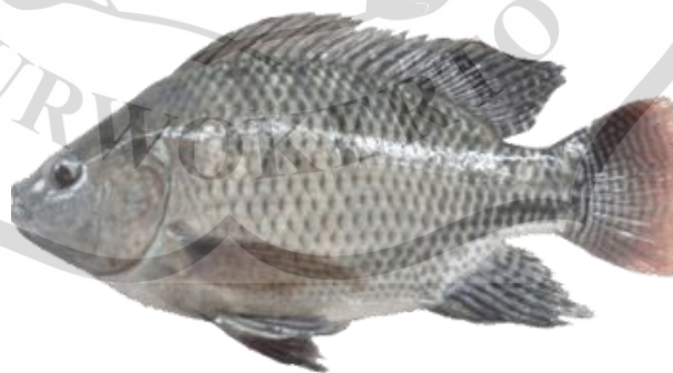
Gambar 2.3 Ikan Nila

Ikan nila merupakan spesies ikan air tawar yang asalnya dari Afrika, namun saat ini telah banyak dibudidayakan di berbagai wilayah dunia, termasuk Asia Tenggara. Secara morfologi, ikan ini memiliki kesamaan dengan ikan mujair. Ikan nila sering dipilih untuk budidaya karena kecepatan pertumbuhannya yang tinggi serta kemampuannya beradaptasi dengan berbagai kondisi lingkungan. Karakteristik utama ikan nila meliputi tubuh yang pipih, sirip punggung yang panjang, dan variasi warna tubuh yang mencakup kombinasi putih, abu-abu, dan merah. Ikan nila bisa dilihat pada Gambar 2.3.