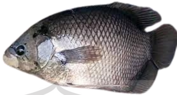
Gambar 2.2 Ikan Gurame