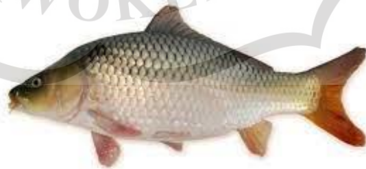
Gambar 2.5 Ikan Mas

Ikan mas memiliki beberapa jenis yang dikategorikan sebagai ikan hias. Ikan mas memiliki beragam warna yang cerah dan menarik. Warna dasar umumnya adalah oranye atau kuning, tetapi melalui seleksi dan pembiakan, telah dikembangkan berbagai varietas yang memiliki warna yang berbeda, termasuk putih, merah, dan hitam. Ciri fisiknya yakni memiliki tubuh yang tegak pipih dengan sisik yang normal dan siripnya yang memanjang. Ikan mas bisa dilihat pada Gambar 2.5.