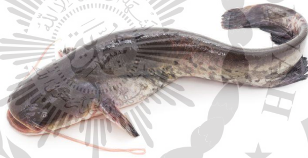
Gambar 2.1 Ikan Lele

Lele merupakan salah satu jenis ikan yang paling mudah untuk dibudidayakan. Ikan lele dapat ditemukan di perairan tawar seperti sungai, danau, rawa, serta kolam budidaya. Ciri khas ikan lele adalah tubuhnya yang licin, agak pipih memanjang, serta memiliki "kumis" panjang yang mencuat dari sekitar mulutnya. Lele termasuk ikan omnivora yang mengonsumsi berbagai jenis makanan, termasuk plankton, serangga, dan bahan organik lainnya. Ikan lele bisa dilihat pada Gambar 2.1.