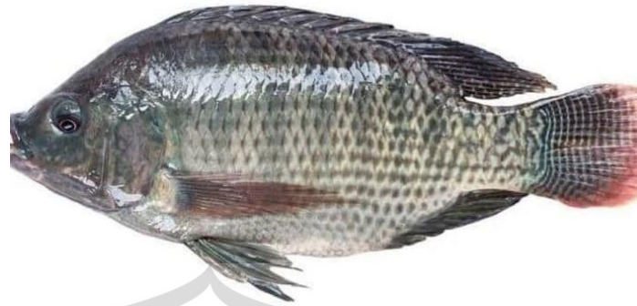
Gambar 2.7 Ikan Mujair