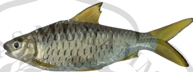
Gambar 2.9 Ikan Wader

mengalir, saluran irigasi, lahan sawah, sungai kecil hingga ke tepian danau atau waduk. Ciri khas utama ikan wader adalah paruh panjang yang digunakan untuk mencari makan di lumpur atau pasir. Meskipun habitat aslinya beragam, tidak jarang ikan wader juga menjadi objek budidaya. Ikan wader bisa dilihat pada Gambar 2.9.