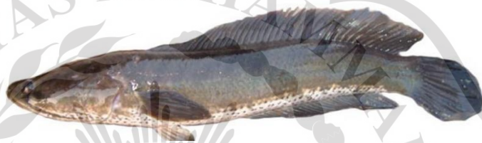
Gambar 2.6 Ikan Gabus

Ikan gabus memiliki bentuk tubuh yang cukup besar dan agak memanjang. Habitat hidupnya kebanyakan ada di sungai, rawa, dan danau. Ikan ini memiliki ciri fisik yakni kepalanya yang mirip dengan ular. Ukuran ikan gabus dapat bervariasi tergantung pada spesiesnya. Beberapa spesies ikan gabus dapat mencapai ukuran yang besar, sedangkan yang lain mungkin lebih kecil. Ikan gabus bisa dilihat pada Gambar 2.6.