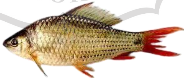
Gambar 2.11 Ikan Nilem

Nilem, yang juga disebut sebagai nilem mangut atau melem, adalah spesies ikan budidaya yang cenderung bersifat herbivora. Ikan ini banyak ditemukan di perairan Asia Tenggara dan menjadi salah satu objek budidaya yang umum di Pulau Jawa, khususnya di wilayah Jawa Barat. Kepala ikan nilem dapat memiliki bentuk yang lancip, dan mulutnya relatif besar. Panjang dan berat ikan nilem dapat bervariasi tergantung pada umur dan kondisi individu. Bagian perut ikan nilem cenderung memiliki warna yang lebih terang dibandingkan dengan bagian atas tubuh. Ini dapat berfungsi sebagai mekanisme perlindungan dari predator di bawah. Biasanya, nilem dibudidayakan sebagai produk tambahan dalam kolam-kolam pemeliharaan ikan seperti mas, nila, atau gurame. Ikan nilem bisa dilihat pada Gambar 2.11