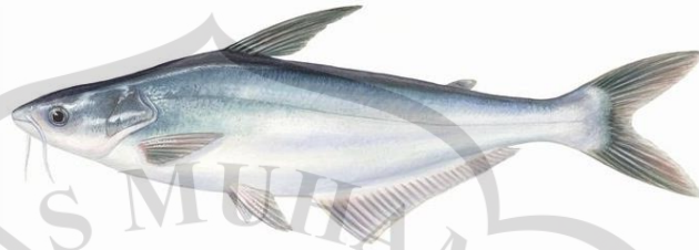
Gambar 2.4 Ikan Patin

yang cukup tinggi. Ciri khas ikan patin mencakup tubuh yang pipih, kepala yang datar, dan sirip ekor yang memanjang. Kulit ikan ini dilapisi oleh sisik halus dengan warna tubuh cenderung keabu-abuan atau hitam. Ikan patin bisa dilihat pada Gambar 2.4.