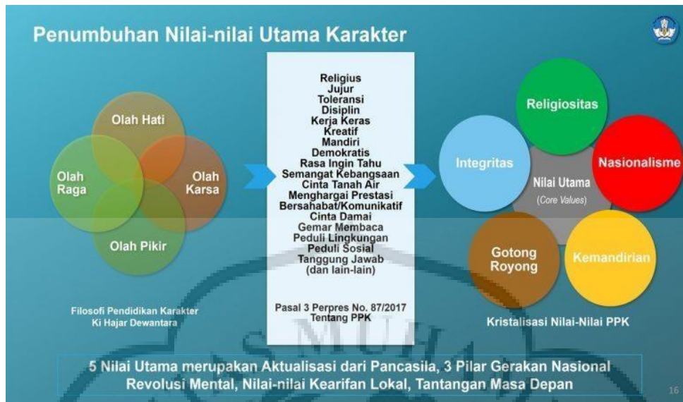
Gambar 2.2. Penumbuhan Nilai-nilai Utama Karakter