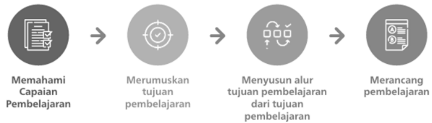
Gambar 2.1 Proses Perancangan Kegiatan Pembelajaran

Sumber : Panduan Pembelajaran dan Asesmen yang diterbitkan oleh BSKAP Kemendikbudristek Tahun 2022