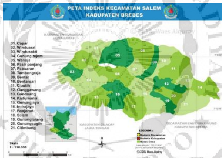
Gambar 2.1 Peta Kecamatan Salem Terlampir

Kecamatan Salem merupakan sebuah wilayah yang dikelilingi perbukitan, memiliki tiga akses untuk kewilayah tersebut dari arah Kersana, Majenang dan Bumiayu. Kemudian memiliki wilayah dataran tinggi yang salah satunya menjadi perbatasan antara Jawa Barat dan Jawa Tengah, sehingga masyarakat Salem hampir keseluruhan memakai Bahasa Sunda dalam berinteraksi kesehariannya dikarenakan dekatnya akses ke wilayah Jawa Barat. Kecamatan Salem memiliki 21 Desa yang menyebar diantara perbukitan yang ada.