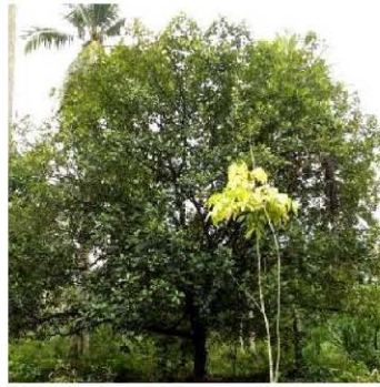
Gambar 2.1. Pohon Cempedak (Muchlis et al. , 2017)

Cempedak termasuk kedalam tanaman monokotil, serta memiliki tinggi tanaman sekitar 15m, batangnya lurus dan silindris berdiameter 40 cm. terdapat benjolan-benjolan pada pangkal batang. Pada batang utama tumbuh ranting, daun dan buah. Kulit kayunya berwarna abu-abu kecoklatan, setebal 2 hingga 3,5 cm, jika dipotong atau dilukai, mengeluarkan getah yang berwarna putih. Pohon cempedak memiliki bunga dengan pola bunga majemuk. Bunga cempedak tersusun dalam bentuk lonjong. Pada satu pohon terdapat bunga jantan dan betina tetapi tumbuh secara terpisah. Bunga cempedak ini tumbuh di ketiak daun, cabang pohon yang ukurannya besar atau di bagian batang pohon. (Rahmawati, 2013).