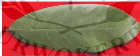
Gambar 2.2. Daun Cempedak (Muchlis et al. , 2017)

Cempedak termasuk kedalam tanaman monokotil, serta memiliki tinggi tanaman sekitar 15m, batangnya lurus dan silindris berdiameter 40 cm. terdapat benjolan-benjolan pada pangkal batang. Pada batang utama tumbuh ranting, daun dan buah. Kulit kayunya berwarna abu-abu kecoklatan, setebal 2 hingga 3,5 cm, jika dipotong atau dilukai, mengeluarkan getah yang berwarna putih. Pohon cempedak memiliki bunga dengan pola bunga majemuk. Bunga cempedak tersusun dalam bentuk lonjong. Pada satu pohon terdapat bunga jantan dan betina tetapi tumbuh secara terpisah. Bunga cempedak ini tumbuh di ketiak daun, cabang pohon yang ukurannya besar atau di bagian batang pohon. (Rahmawati, 2013).