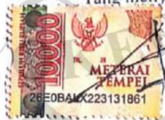
Arum Puspita Ambarwati

Dibuat di : Purwokerto Pada tanggal : 12 Juli 2024 Yang menyatakan,