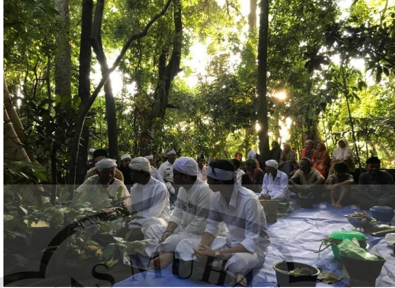
Gambar 2.1 Prosesi Pelaksanaan Upacara Adat Ngasa Jalawastu

Makna pada upacara adat Ngasa atau sedekah gunung pada buku Pelatihan Teater Budaya Jalawastu Berbasis Digitalisasi (2019) memiliki tiga nilai utama: