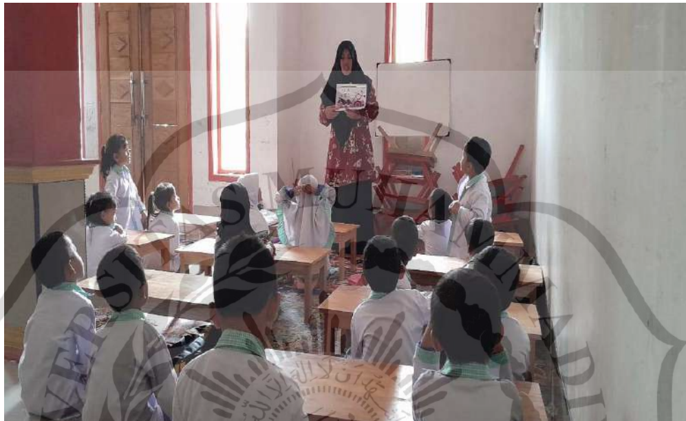
Foto Dokumentasi Kegiatan Penelitian

Guru sedang melaksanakan kegiatan pembelajaran dengan menggunakan metode bernyanyi melalui media kartu bergambar