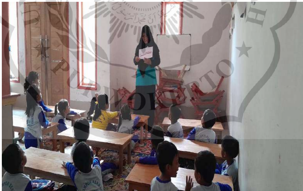
Guru mengulang menjelaskan penggunaan media kartu bergambar pada akhir kegiatan pembelajaran