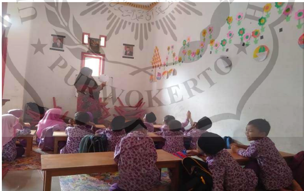
Guru menjelaskan penggunaan media kartu bergambar yang digunakan dalam pembelajaran