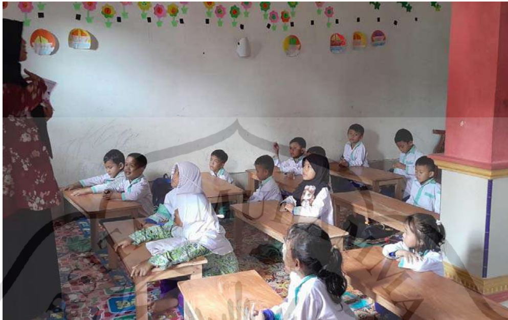
Guru melaksanakan kegiatan tanya jawab tentang media kartu bergambar yang digunakan dalam pembelajaran