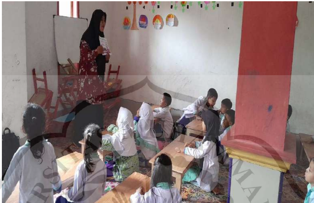
Guru menunjukkan cara menentukan judul lagu yang sesuai dengan media kartu bergambar yang digunakan