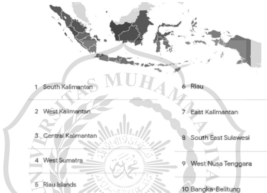
Gambar 1.2. Kota dan Provinsi di Indonesia yang Paling Banyak Mencari tentang Anime pada tahun 2023..

Di Indonesia sendiri, Kalimantan Selatan menjadi peringkat pertama dengan pencarian terbanyak tentang anime di google.