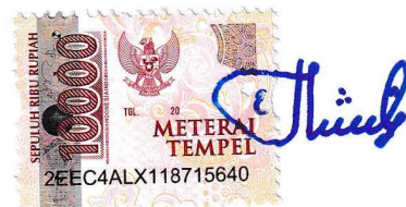
Azizah Mega Auliyansa

Dibuat di : Purwokerto Pada Tanggal : 03 Mei 2024 Yang menyatakan