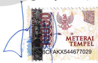
Dinda Cahyaning Pramasinta

Dibuat : Purwokerto Pada tanggal : 3 Mei 2024 Yang menyatakan ,