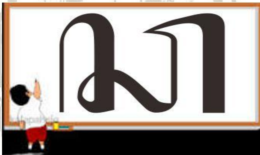
Gambar 2.2 Kartu huruf aksara Jawa

Dagun (2006: 451), kartu adalah sebuah alat untuk menunjukkan data produksi dalam bentuk grafik. Huruf adalah tanda aksara dalam tata tulis yang merupakan anggota abjad yang melambangkan bunyi bahasa (Tim Redaksi KBBI, 2007: 413).