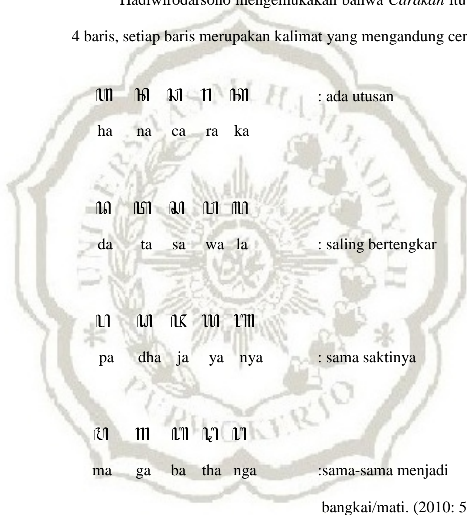
Gambar 2.1 Huruf dasar aksara Jawa.

Hadiwirodarsono mengemukakan bahwa Carakan itu ditulis 4 baris, setiap baris merupakan kalimat yang mengandung ceritera: