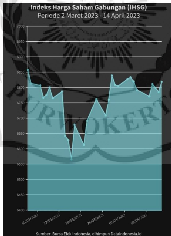
Gambar 1.2 Indeks Harga Saham Gabungan (IHSG) Periode 2 Maret 2023 – 14 April 2023