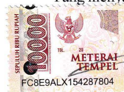
Berlian Toto Nurrahma

Dibuat di : Purwokerto Pada tanggal : 6 Mei 2024 Yang menyatakan,