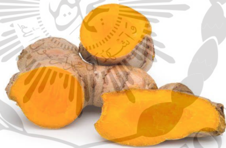
Gambar 2.1 Tanaman Kunyit ( Curcuma longa L.) (Kumar & Sakhya, 2013)

Kingdom : Plantae Divisi : Magnoliophyta Class : Liopsida Subclass : Zingiberidae Ordo : Zingiberales Famili : Zungiberaceae Genus : Curcuma Spesies : Curcuma longa L.