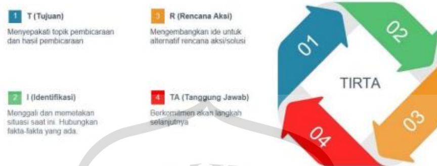
Gambar 1 Model Tirta

Supervisi akademik berbasis coaching dengan Model TIRTA yang dikembangkan oleh Kemdikbud (2021) dapat dijelaskan sebagai berikut: