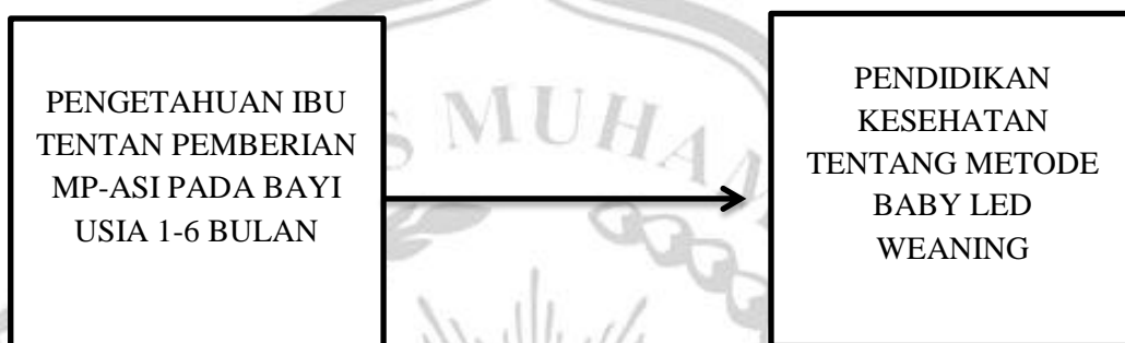
Gambar 2.2 Kerangka Konsep

Kaitan atau hubungan antar konsep atau variabel yang akan diamati atau dinilai melalui penelitian digambarkan dan divisualisasikan dalam kerangka konseptual (Notoadmodjo,2012).