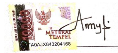
Aya Cut Amaya