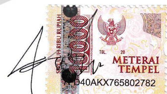
Fika Puspita Ningrum