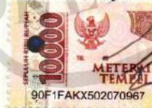
Elanda Nur Azizzah