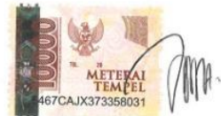
Windi Nur Oktaviany