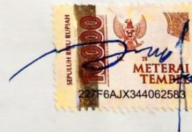
Nur Syahrul Safinah