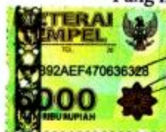
Pipit Atiyah Romadhoni