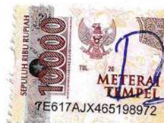
Fadila Famelia Nur Affi