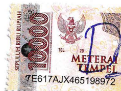
Fadila Famelia Nur Affi