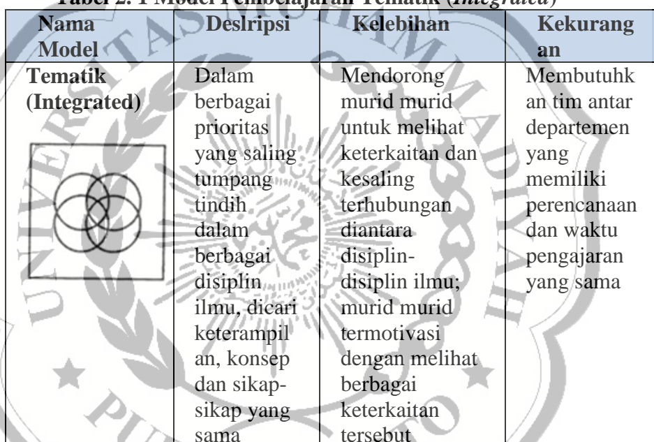
Tabel 2. 1 Model Pembelajaran Tematik ( Integrated )

Fogarty (dalam Trianto, 2010: 45) mengemukakan bahwa terdapat sepuluh model pembelajaran tematik, namun yang digunakan saat ini untuk pembelajaran adalah pembelajaran tematik ( integrated ), yang disajikan dalam Tabel 2.1.