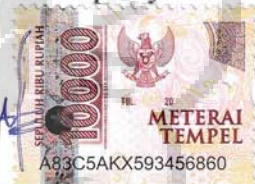
Nur Afif Yunianto