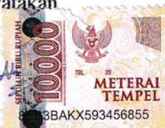
Nur Afif Yunianto