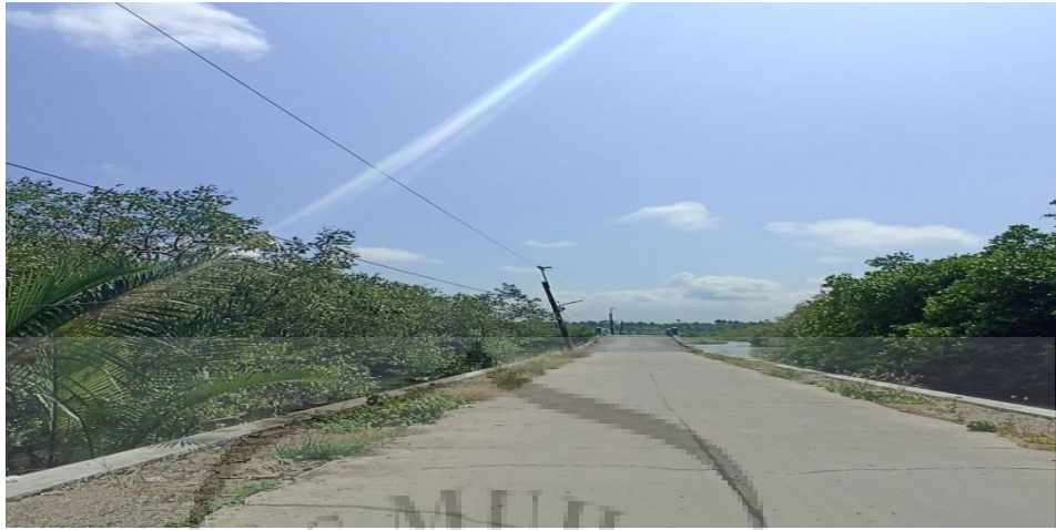
Gambar 2. Hutan mangrove di sepanjang jalan Kutawaru

Potensi desa Kutawaru tidak hanya dari segi perikanan, tetapi pertanian, peternakan, termasuk ada budidaya ikan, penyulingan minyak kayu putih industri ini juga merupakan salah satu program binaan dari CSR Holcim, tambak udang, dan masih banyak lagi. Selain itu di sepanjang daerah kutawaru terdapat tanaman bakau, dan juga wisata hutan bakau, saat menyebrang menuju Kutawaru menggunakan perahu di sepanjang jalan kita akan disuguhi pemandangan hutan bakau yang indah, terdapat Patra Bahari Food Center di Kutawaru yang merupakan suatu inisiatif yang dilakukan oleh Pertamina bekerja sama dengan Kelurahan Kutawaru, Lembaga Pemberdayaan dan Pembangunan Masyarakat Kelurahan (LPPMK) Kutawaru, serta Kelompok Sadar Wisata (Pokdarwis) setempat untuk merapikan area pedagang kuliner dengan menyediakan 15 lapak yang dibuka setiap hari mulai pukul 08.00 hingga 19.00 WIB. Lapak-lapak didesain secara rapi dan nyaman serta menyajikan kuliner khas Kutawaru, termasuk cimplung, olahan kepiting, mendoan, lotek, beragam minuman, dan berbagai hidangan lainnya tersedia di sana. Sosialisasi mengenai pariwisata bagi masyarakat Kutawaru sangat penting, karena di samping untuk mengembangkan wisata di sana namun menambah perekonomian masyarakat Kutawaru.