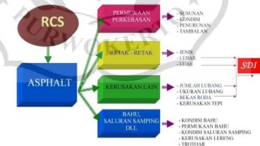
Gambar 2.3 Tinjauan Permukaan Jalan Aspal

Surface Distress Index (SDI) adalah sistem penilaian kondisi perkerasan jalan berdasarkan dengan pengamatan visual dan dapat digunakan sebagai acuan dalam usaha pemeliharaan (Bina Marga, 2011). Dalam pelaksanaan metode SDI, ruas jalan akan disurvei dan dibagi kedalam segmen-segmen. Metode ini merupakan pemeriksaan secara visual dengan data parameter luas total keretakan, lebar rata-rata keretakan, jumlah lubang, dan kedalaman bekas roda kendaraan.