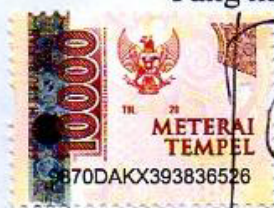
Rizki Utami Nur Azizah