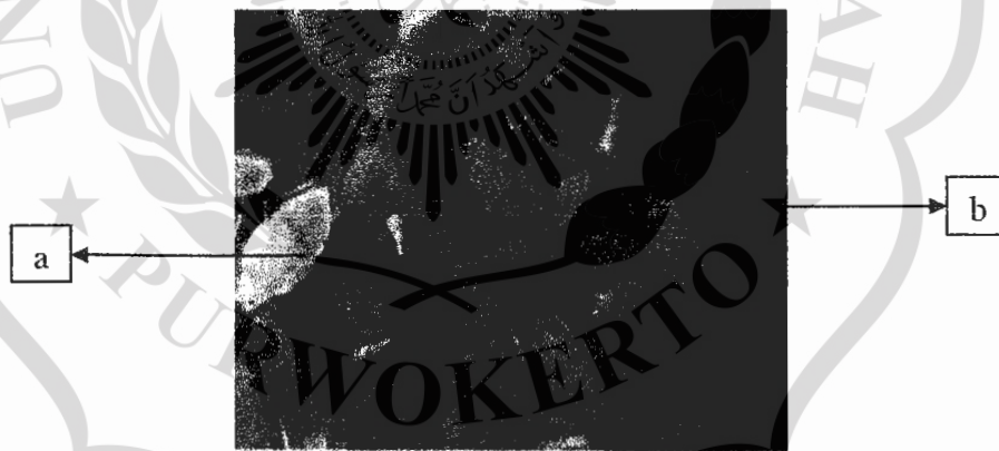
Gambar 2.2. koloni Myzus persicae (Susetyo, 2016), a. imago M. persicae b. nimfa M. persicae (Susetyo 2016)

M. persicae merupakan hama penting pada tanaman cabai. Serangan yang diakibatkan oleh hama kutu daun umumnya terjadi pada awal musim kemarau. Tanaman cabai yang terserang hama kutu daun tumbuhnya tidak normal, pertumbuhannya terhambat dan daun pucuknya mengkerut serangan berat dapat mengakibatkan gagal panen, sehingga mengakibatkan petani cabai menderita kerugian yang cukup besar. Kutu daun menghisap cairan tanaman cabai pada bagian bawah permukaan daun muda dan bagian lainnya yang masih muda. Tanaman cabai yang terserang akan menunjukkan daun berkeriput, pucuk tanaman keriting dan menggulung, sehingga pertumbuhan tanaman terhambat. Bila tanaman cabai terserang berat, tampak keriting dan tertutup lapisan hitam cendawan jelaga dan akhirnya mati (Sodiq, 2019).