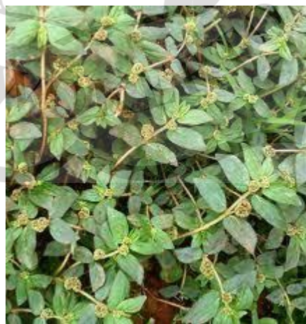
Gambar 2.1 Tanaman patikan kebo (BBPPTOOT, 2010)

Tanaman patikan kebo banyak dijumpai di berbagai daerah di Indonesia karena tumbuh di daerah tropis, ditemukan di rerumputan,