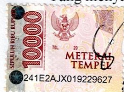
Fahmi Ichlasul Amal