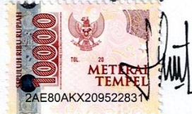
Windah Mei Prasinta