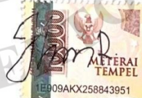
Reza Arief Bayu Prabowo