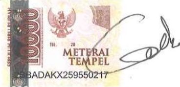
Nadila Nuraning Diah