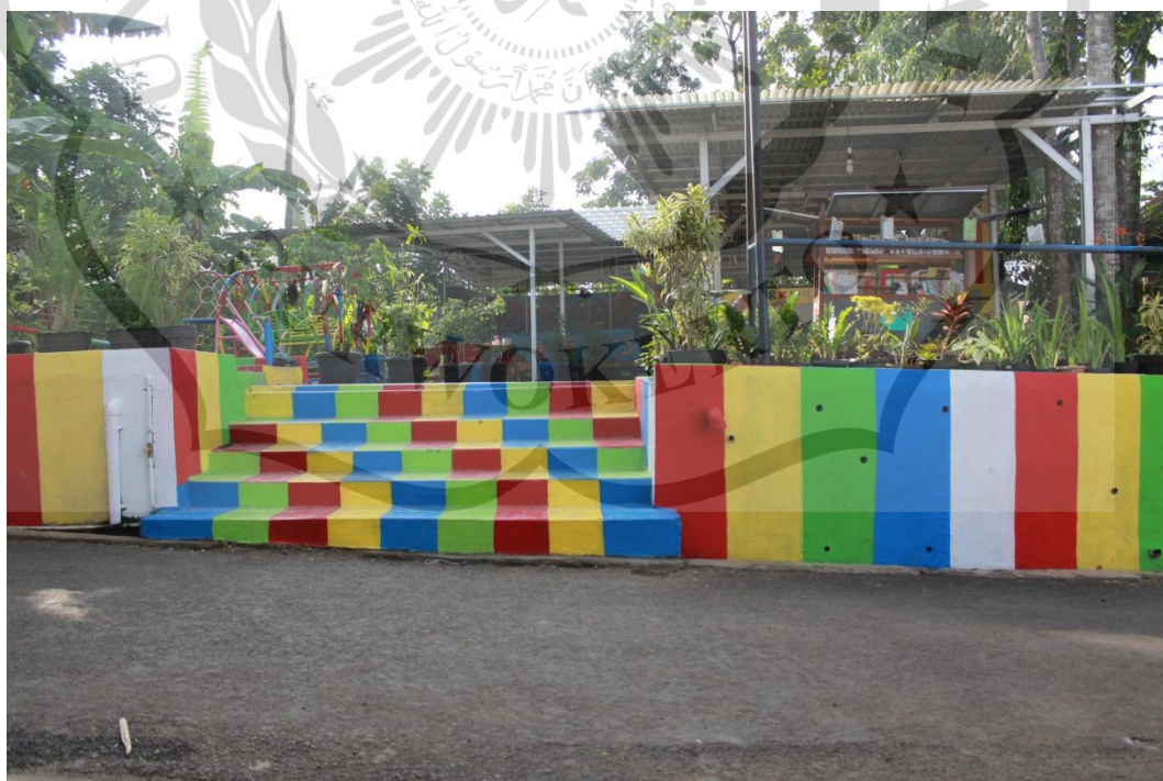
Gambar 2.1 Bangunan Ruang Baca TBM Wadas Kelir, PAUD, Paket B dan C (Dokumen Peneliti)

TBM Wadas Kelir yang merupakan bangunan baru itu, merupakan hasil 10% dari penghasilan yang didapatkan, baik oleh relawan maupun Heru Kurniawan. Jadi ketika mendapatkan penghasilan yang hasilnya dari Wadas Kelir, maka 10% masuk manajemen untuk bangunan dan pengelolaan sampai sekarang (Wawancara Risdianto Hermawan, 17 April 2017).