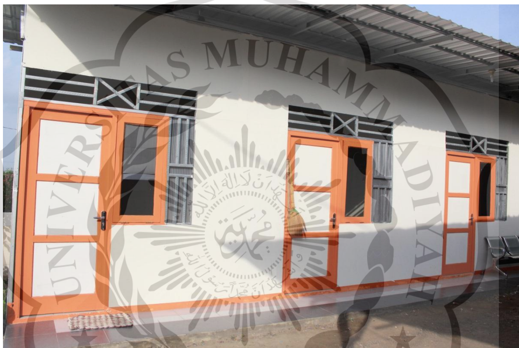
Gambar 2.2 Bangunan Toko Buku, Wadas Kelir Publishing dan Kantor Pendidikan (Dokumen Peneliti)