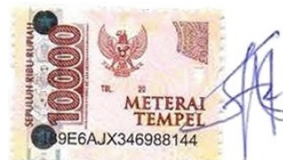
Yuniar Esa Pangesti