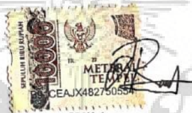
Wilda Rezana Auhan

Purwokerto, 13 Agustus 2022 Yang membuat pernyataan