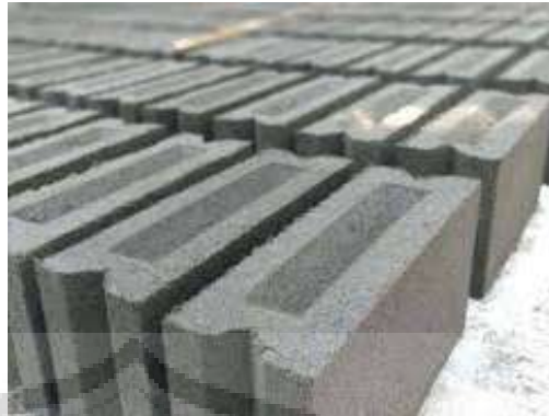
Gambar 2.2. Batako Semen ( Press )

Adapun persyaratan kuat tekan minimum batako pejal sebagai bahan bangunan dinding dapat dilihat pada tabel berikut :