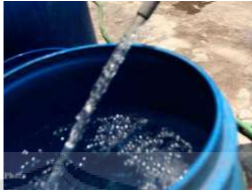
Gambar 2.6. Air