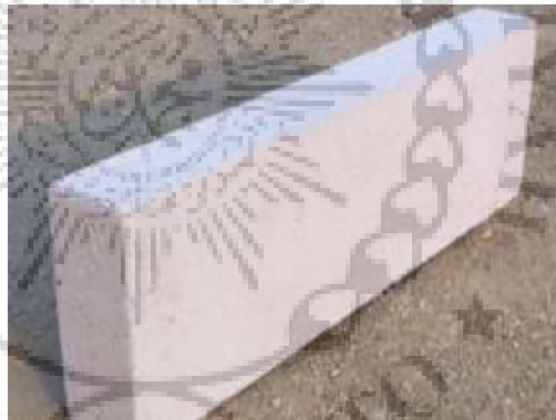
Gambar 2.1. Batako Putih ( Tras )

Batako putih dibuat dari campuran tras, batu kapur, dan air yang kemudian campuran tersebut dicetak. Tras merupakan jenis tanah berwarna putih/putih kecoklatan yang berasal dari pelapukan batu-batu gunung berapi. Batako jenis ini memiliki ukuran panjang 25-30 cm, tebal 8-10 cm, dan tinggi 14-18 cm.