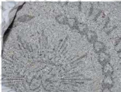
Gambar 2.7. Abu Sekam Padi