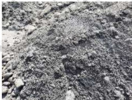
Gambar 2.5. Agregat Halus (Pasir)