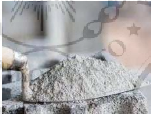
Gambar 2.4. Semen

Semen Portland tipe V biasanya digunakan untuk konstruksi bangunan pada air atau tanah yang mengandung sulfat lebih dari 0,20% dan sangat cocok digunakan untuk pembuatan instalasi pengolahan limbah pabrik, konstruksi dalam air, jembatan, terowongan, pelabuhan, dan pembangkit listrik tenaga nuklir.