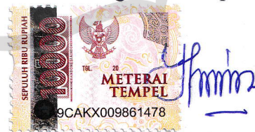
Yuni Dwi Setiawati