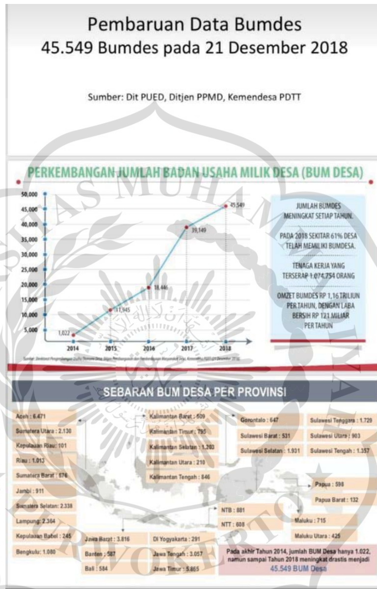
Gambar 1.1 Data BUMDes di seluruh Indonesia