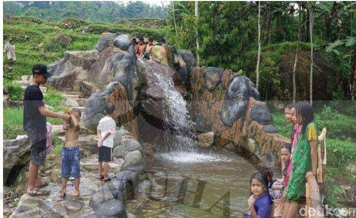
Gambar 1.5 Grujungan Bengkok