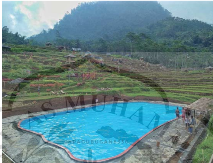
Gambar 1.2 Kolam Renang