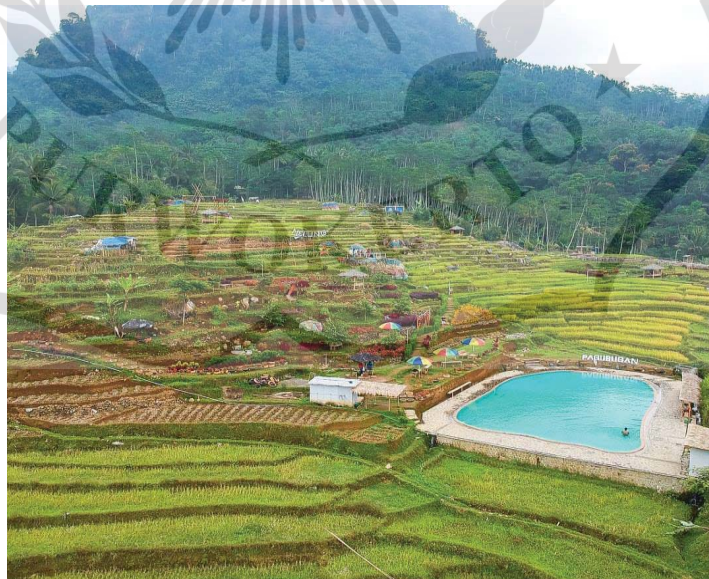
Gambar 1.4 Wisata Melung