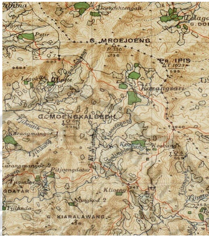
Gambar. Peta Pulau Jawa di wilayah Dayaluhur dan Gunung Maruyung 1825