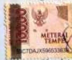
Nurul Ayu Setiowati