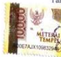
Nurul Ayu Setiowati