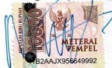
Mada Tungga Puspa