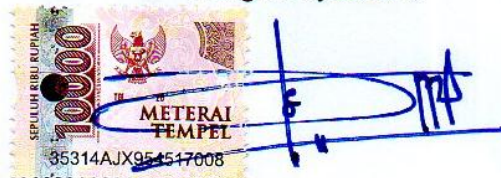
Catur Aji Setyani