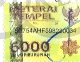
Vita Kusuma Dewi

Dibuat di : Purwokerto Pada tanggal : 25 Agustus 2020 Yang menyatakan